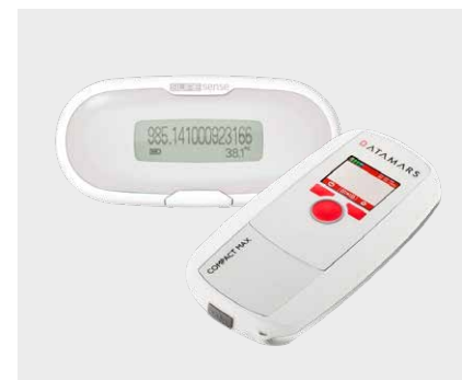
Le lecteur de puce, très apprécié dans la boutique en ligne du STMZ