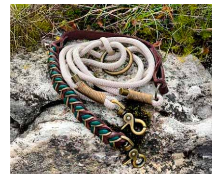
Ces laisses élégantes allient confort et design