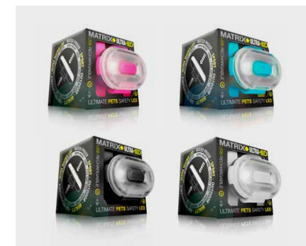
Grâce aux lampes LED, chiens et propriétaires restent visibles dans l'obscurité