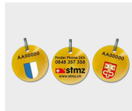
Nos médailles, autres grands succès du STMZ